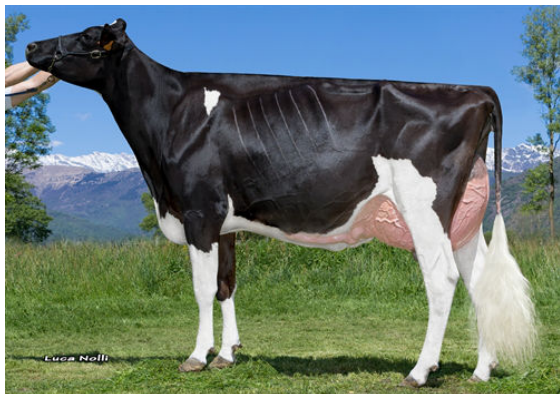
AGRILAT MERIDIAN LIL KIM