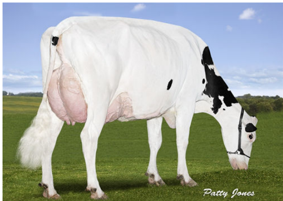
GILLETTE WALKHAVERN ASLEEP